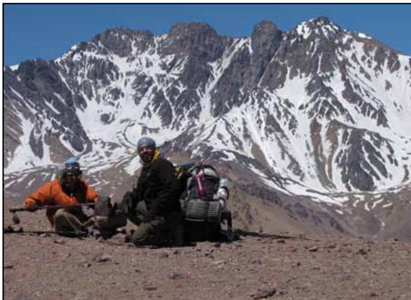
FIGURA 4.7 El cordón Doris-Central desde el portezuelo Serrata

Ascender el cerro Serrata, 4.224 m, desde este sitio demanda poco tiempo y escaso desnivel: hay que encaramarse hacia el este, intentando no enriscarse ni entrar en terreno demasiado blando. Se irán dejando algunas lomas y al final aparecerán varias alturas que podría uno tomar por la cumbre. Aunque se ubiquen comprobantes y un pedestal uno tendrá la sensación que podría seguir recorriendo el filo hacia el este para despejar dudas. Como ocurre con casi todos los cuatromiles de la zona, la vista que se abarca sin interrupciones por todo el horizonte (fig. 4.7 abajo).