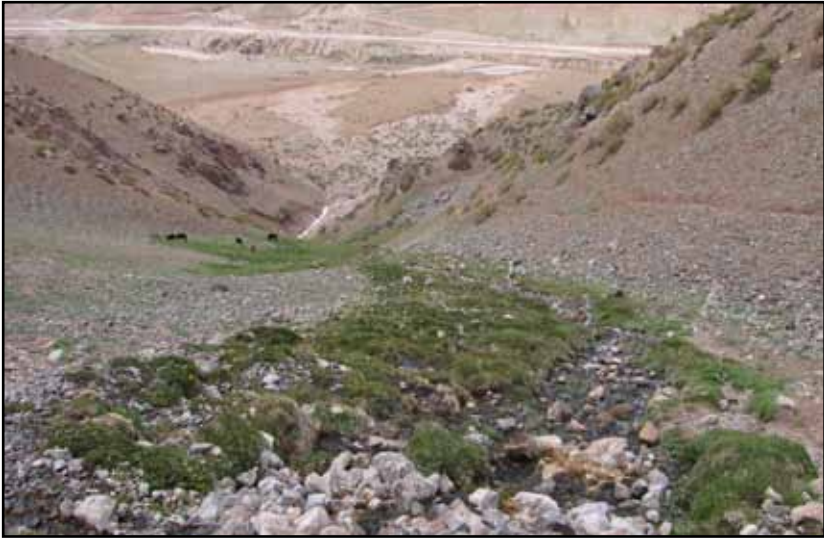
FIGURA 4.1. Arriba: El Llano Pelado y la ruta. En primer término las vegas empinadas. Abajo: El tramo previo a las angosturas. A la izquierda cerro Penitentes o de la Iglesia (la cumbre no está visible).

FIGURA 4.2 (Pág. siguiente) Sobre los 3.200 m, el refugio. La altura de la izquierda es un cerro menor antepuesto al cerro Serrata, el de la derecha la Altura Madre. Entre ambas se abre el portezuelo Serrata. La colina con pasto a la derecha es probablemente una morena lateral del antiguo glaciar que provenía de la quebrada Laguna Seca (a la derecha), en este sitio giraba y se internaba en la quebrada de Vargas. Desde el retiro del hielo se ha ido acumulando roca suelta que tiende a rectificar las naturales formas de un valle glaciar.