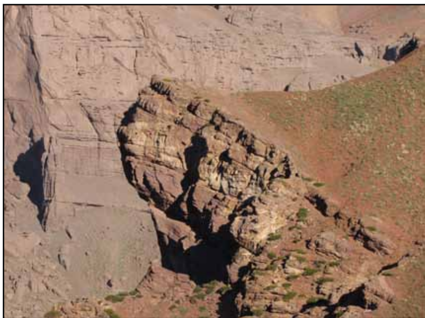
FIGURA 4.3 Una forma repetida en los riscos que afloran sobre las laderas oeste de la quebrada de Vargas.

En cualquier caso no se atribuye a los restos un sentido práctico sino ceremonial, una llamada plataforma artificial .