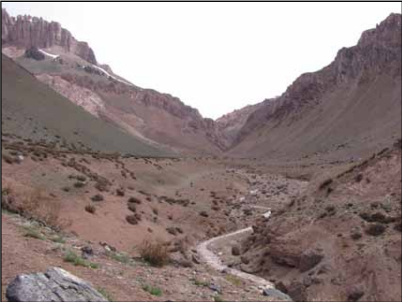
FIGURA 4.2 (Pág. siguiente) Sobre los 3.200 m, el refugio. La altura de la izquierda es un cerro menor antepuesto al cerro Serrata, el de la derecha la Altura Madre. Entre ambas se abre el portezuelo Serrata. La colina con pasto a la derecha es probablemente una morena lateral del antiguo glaciar que provenía de la quebrada Laguna Seca (a la derecha), en este sitio giraba y se internaba en la quebrada de Vargas. Desde el retiro del hielo se ha ido acumulando roca suelta que tiende a rectificar las naturales formas de un valle glaciar.