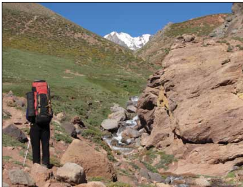
FIGURA 4.5 La continuidad geográfica de la quebrada de Vargas es la de Laguna Seca. Aunque el caminante se dirija al portezuelo Serrata, después de la confluencia debe continuar un pequeño trecho por este último valle.

La confluencia principal, a unos 3.300 m es la que une el arroyo de Laguna Seca con el de Vargas, coloreado por las rocas de la formación Tordillo. En la unión existe un sitio alargado y cubierto de cantos rodados, algo escabroso, pero camino necesario hacia las alturas.