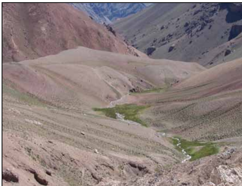
FIGURA 4.8 Arriba: Las Vegas Largas.

Abajo: La árida imagen del cerro Serrata extremo suroeste de la serranía ubicada entre el río Tupungato y la quebrada de Vargas, Divisoria 11 de Febrero. A la derecha se insinúa el portezuelo Serrata.